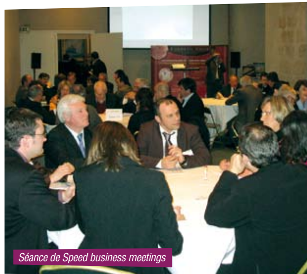
Séance de Speed business meetings

Créateur et partenaire historique de la Cosmetic Valley, le CODEL soutient activement le développement de ce pôle de compétitivité, notamment vers les entreprises d'Eure-et-Loir. C'est dans ce sens qu'il organise chaque année Cosmetech, une convention d'affaires Internationale de la Parfumerie et des Cosmétiques, dans le cadre des Rencontres de la Cosmetic Valley à Chartres.