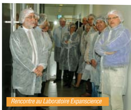
Rencontre au Laboratoire Expanscience

Initiées l'année dernière par le CODEL, ces rencontres permettent un rapprochement entre chefs d'entreprises et élus locaux afin d'améliorer l'attractivité du département en mobilisant les forces économiques d'Eure-et-Loir.