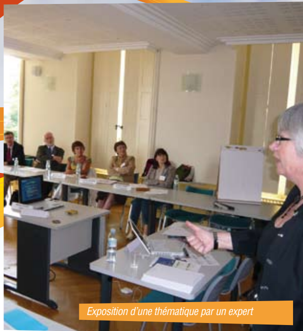
Exposition d'une thématique par un expert

Plus de 15 rencontres du Pacte sont prévues sur le département pour 2009